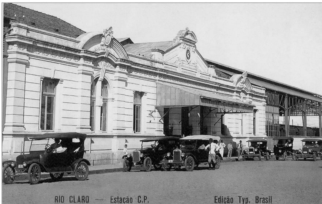
Figura 3: Vista do segundo edifício da Estação Ferroviária da Companhia Paulista de Estradas de Ferro , década de 20, construído no mesmo local do primeiro, demolido em 1910.

publico, quer nas acomodações reservadas aos chefes e suas famílias. Aposentos vastos, arejamento perfeito, água encanada, boa iluminação, tudo se encontra nessas habitações”. 31