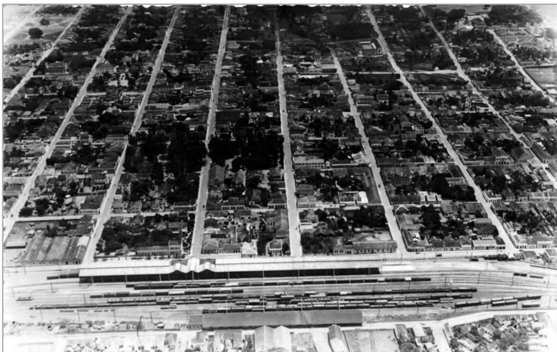
Figura 4: Vista aérea parcial da área central de Rio Claro, década de 20. Destaca-se o edifício da Companhia Paulista de Estradas de Ferro (parte posterior da imagem) e o parcelamento em “tabuleiro de xadrez” , cuja ordenação numérica tem o prédio da Estação Ferroviária como referência.

“Indico à Câmara para facilitar o conhecimento das ruas e para evitar-se ao mesmo tempo a confusão dos nomes próprios e vulgares, com que são de ordinário designadas aqui as nossas ruas que se adopte o systema simples e racional usado em muitas cidades dos Estados Unidos da América do Norte – a Numeração. Tomando-se por ponto de partida a Estação de Estrada de Ferro da Paulista, todas as ruas verticais a esse ponto se denominarão ‘Avenidas’ e terão os números ímpares para as que ficarem ao lado esquerdo da rua do Comércio – esta, receberá o número um e os números pares para as que ficarem à sua Direita. As ruas transversais serão numeradas na ordem em que se acharem, a partir do mesmo ponto – a Estação e, receberão a designação de ‘RUAS’. Exemplo: Rua nº ...; Avenida nº ... (...).” 34