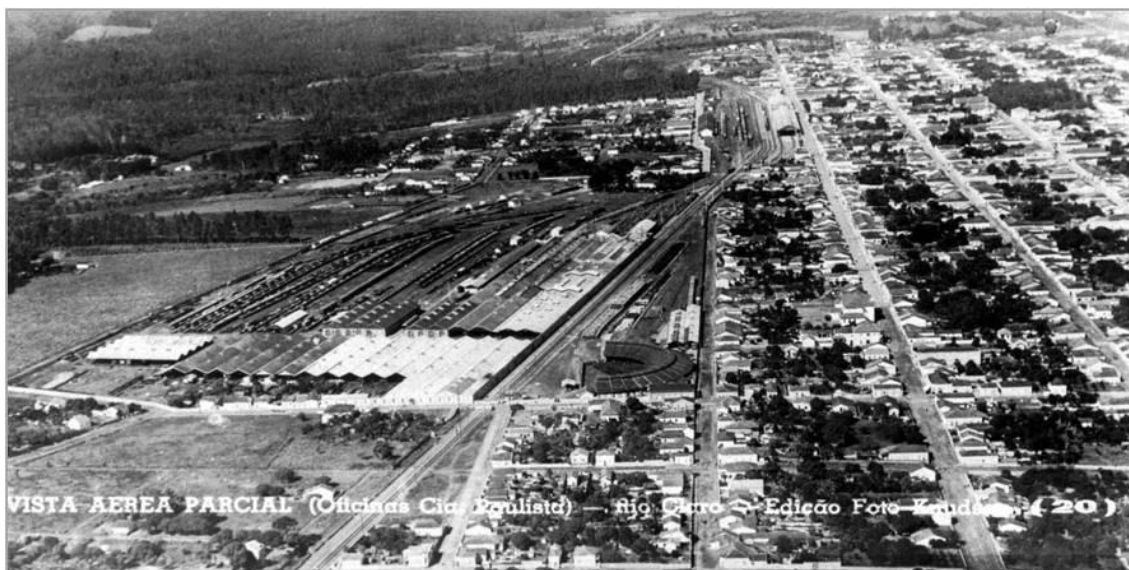
Figura 2: Vista aérea parcial da área central de Rio Claro, década de 20. Destaca-se o conjunto dos edifícios das oficinas da Companhia Paulista de Estradas de Ferro (lateral esquerda da imagem) e o início do parcelamento em área “além-trilhos” .